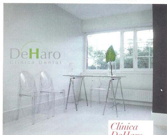
Clínica DeHaro PINTADA EN UNA SABIA COMBINACIÓN DE GRISES Y CON MOBILIARIO DE PHILIPPE STARCK.

ra los más pequeños en las citas de ortodoncia, catering de bebidas, kits de higiene oral si no han tenido oportunidad de realizarla antes de la cita...», enumera el doctor Moraleda. Y en la sala de intervenciones: instrumental silencioso, sistema inalámbrico de aviso al personal auxiliar, monitores con imágenes relajantes accesibles a la vista del paciente, una carta (por autores o géneros) de música de ambiente y sillones de alta gama orientados hacia un gran ventanal con vistas a las cuatro torres del centro financiero. «El efecto es, según narran muchos pacientes, el de encontrarse en la sala de mandos de una nave espacial con vistas espectaculares», comenta el doctor. El arte también tiene su hueco en Smilelife: «He seleccionado dos obras de Julio del Álamo realizadas especialmente para nosotros: Dislexia y Osteointegración , inspirada en un corte histológico donde se observa la armonía del titanio con las células del hueso», explica Moraleda. El diseño y las comodidades para el paciente son un sello de calidad, pero el lujo para el doctor está también en «tratar a los pacientes con psicología, sin prisas y con explicaciones claras y sencillas que