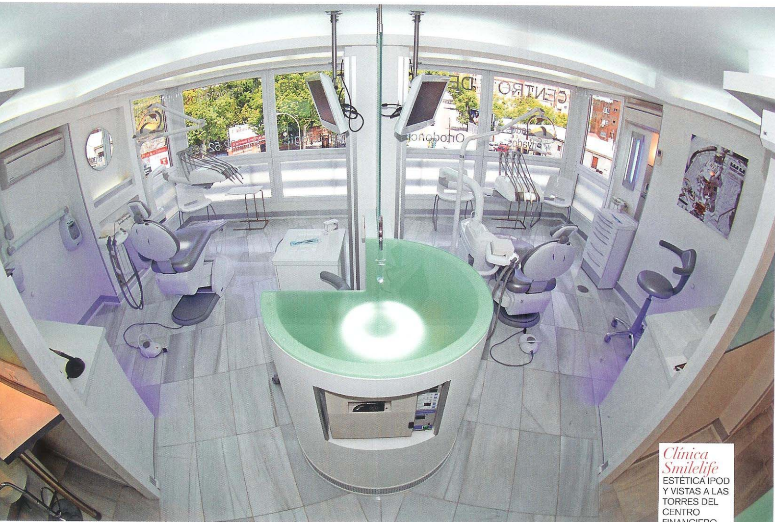
Clínica Smilelife ESTÉTICA IPOD Y VISTAS A LAS TORRES DEL CENTRO FINANCIERO.

ción de una de las clínicas que dirige en Madrid. «Ha sido una labor a medias con el interiorista César Oliva, yo definí la estética iPod (cristal, acero y superficies blancas brillantes) y César la distribución de los espacios y el diseño de luz (linestras indirectas y leds de refuerzo vertical)», explica el doctor que reconoce que el espacio de trabajo juega un papel fundamental: «Pasamos mucha parte de nuestra vida aquí y el ambiente tiene que ser lo más favorable posible para que tanto nuestro equipo como los pacientes, que acuden a veces con un grado importante de ansiedad, se encuentren en un espacio en el que perciban con los cinco sentidos estímulos de luz, limpieza, serenidad y confort. Además, trabajar en un ambiente agradable hará que seamos más receptivos, sensibles y nuestro resultado sea el óptimo». Para contribuir a esta comodidad y relajación, en la Clínica Smilelife cuentan con varias salas de espera «para mantener la privacidad de las personas que lo requieran, asientos muy confortables, luz exterior con vistas, prensa actualizada, Wi-fi, monitores de televisión con distintas ofertas que incluyen videojuegos de especial interés pa-