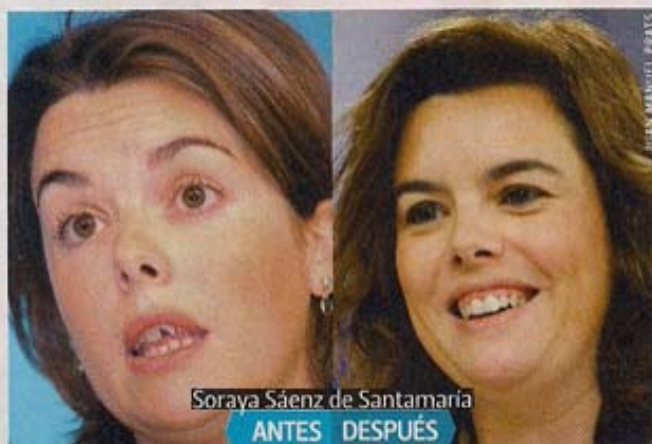
Soraya Sáenz de Santamaría ANTES DESPUÉS