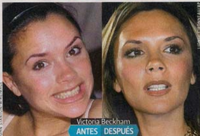
Victoria Beckham ANTES DESPUÉS