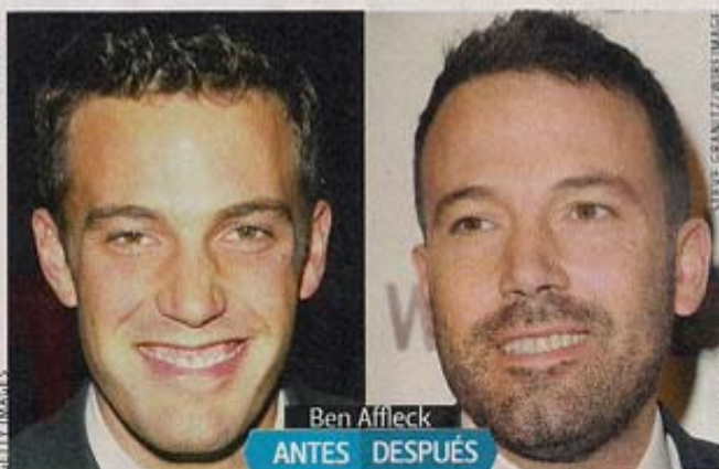
Ben Affleck ANTES DESPUÉS