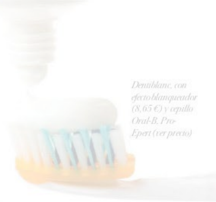
Denúblanc, con efecto blanqueador (8,65 €) y cepillo Oral-B Pro-Expert (ver precio)