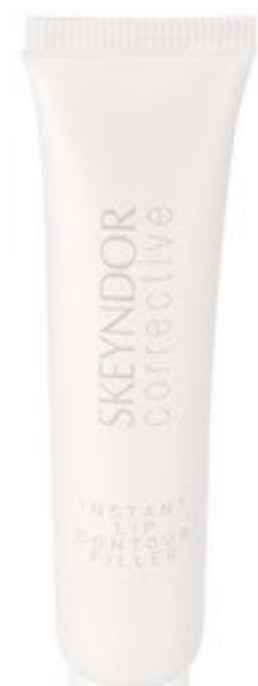
Para labios: Corrective Instant Lip Contour Filler, de Skeyndor (35,50 €, en inst.)