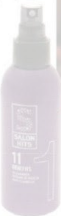
Il Benefits, de Salon Hits (10,20 €, en peluq.)

Un corte fresco y un color acertado son decisivos para rejuvenecer todo un look. Además, según el gurú capilar Christophe Robin, «no existe gesto más sexy que dejar caer un mechón lateral delante del rostro y retirarlo con la mano».