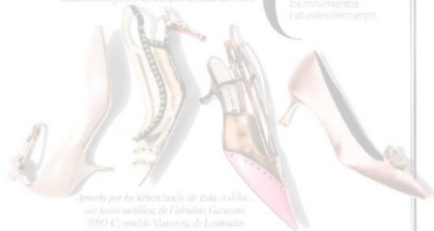
Ajunta por los kitten heels: de izda. a dcha., con tacón metálico, de Valentino Garavani (690 €); modelo Manóvra, de Louboutin (675 €); bicolor, de Mia Miu (430 €); y modelo Harast, de Manolo Blahnik (690 €).